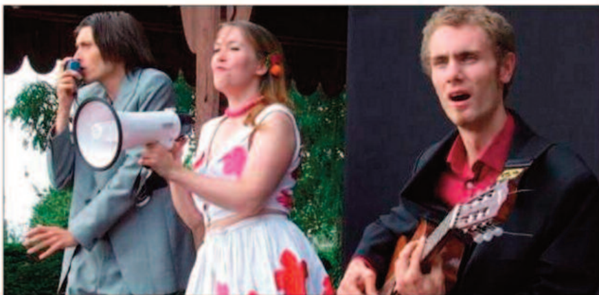
Garancières-en-Drouais, dimanche. Les trois compères de BAM déploient une énergie folle sur scène pour mettre en valeur chaque bon mot de Bourvil.

De nombreuses têtes blanches ont repris en chœur les refrains les plus connus tels que Le Petit bal perdu ou A Joinville-le-Pont mais Parce que Bourvil est aussi un spectacle théâtral avec une mise en scène qui donne l'illusion d'être sur une placette de village, celle de Bourville, village d'enfance de l'artiste. Pas d'imitation dans ce show mais la création d'un réel univers, mélange d'années folles et de symphonie pastorale, bref une belle Salade de Fruits rafraîchissante. Dans une ambiance nostalgique où l'on parle de ravitaillement, de pique-nique et surtout d'amours, Antoine l'homme-orchestre a réarrangé chaque chanson aux sonorités manouche ou latino avec sa guitare, son kazoo ou ses percussions. Ses deux compères, eux, se trémoussent et jouent avec des boîtes de conserve, un fil à linge ou un